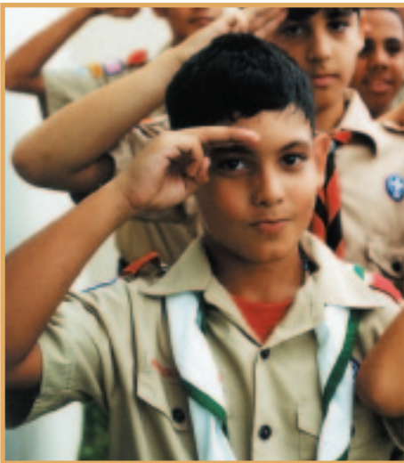
Los Niños Escucha de Puerto Rico son embajadores naturales para la iniciativa de FEMA Proyecto Impacto: Construyendo Comunidades Resistentes a Desastres.