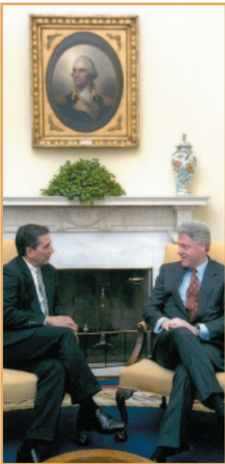
El gobernador Rosselló y el presidente Clinton discuten las necesidades de vivienda de Puerto Rico como resultado del huracán Georges.