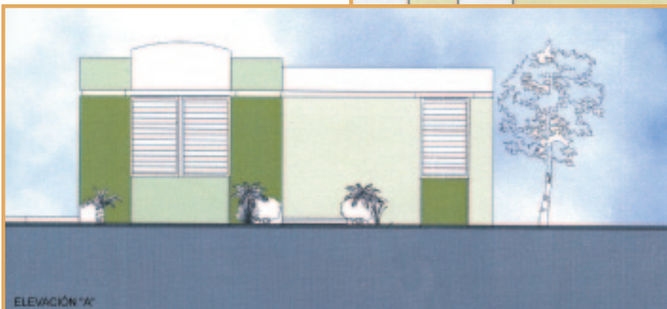
Plano para la casa modelo de dos habitaciones en Toa Baja.